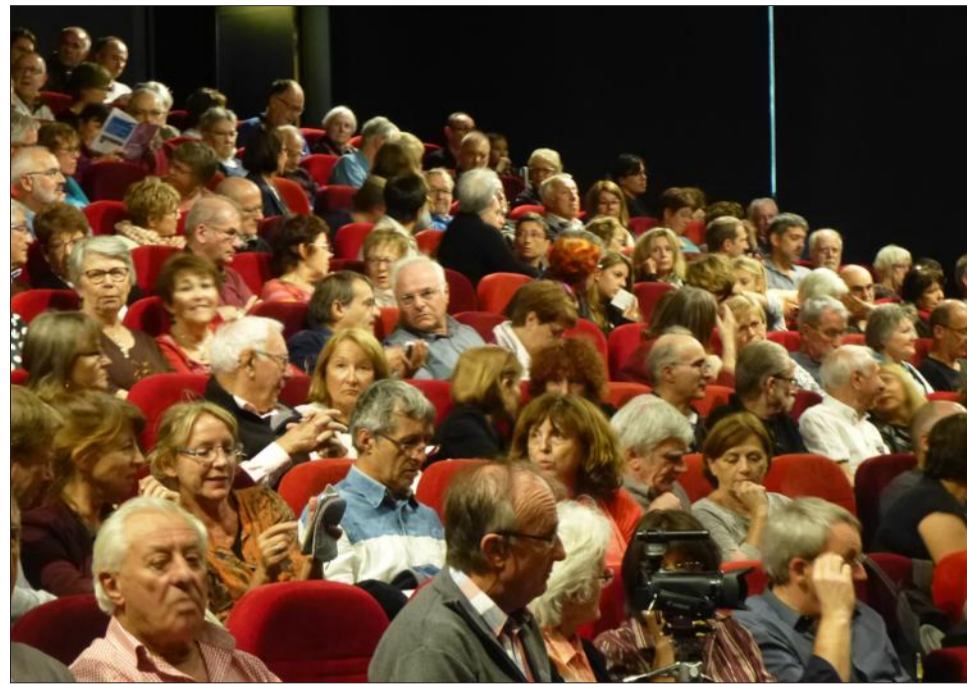
Le public chanceux d'avoir pu avoir des places pour le concert qui a très vite affiché complet.

Dimanche à La Vence Scène, les Saint-Égrévois ont assisté à un très grand spectacle en ouverture du 13 e festival Jazz de Grenoble Alpes Métropole. Ce concert, interprété par le "Big Band Soli-s'Airs", les élèves et professeurs de l'atelier chanson et du département "jazz et musiques actuelles" de L'Unisson, s'intitulait "Imagine... The Beatles" et rendait hommage aux quatre garçons dans le vent, Paul McCartney, George Harrison, John Lennon et Ringo Starr.